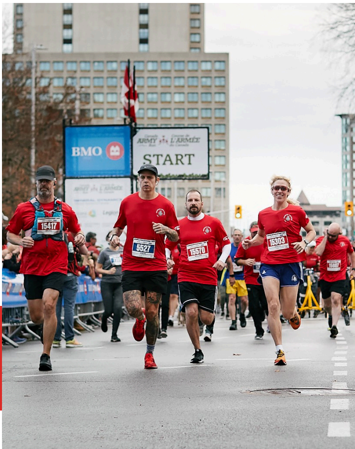
L'équipe de la Course de l'armée du Canada Sans Limites comptait 33 participants pour 2023.

La Course de l'Armée du Canada continue d'être une activité de collecte de fonds de premier plan pour les causes caritatives officielles des Forces armées canadiennes, Appuyons nos troupes et Sans Limites. Cette année, plus de 13 000 participants ont marché, couru ou roulé, en personne ou virtuellement, pour célébrer notre armée canadienne moderne.